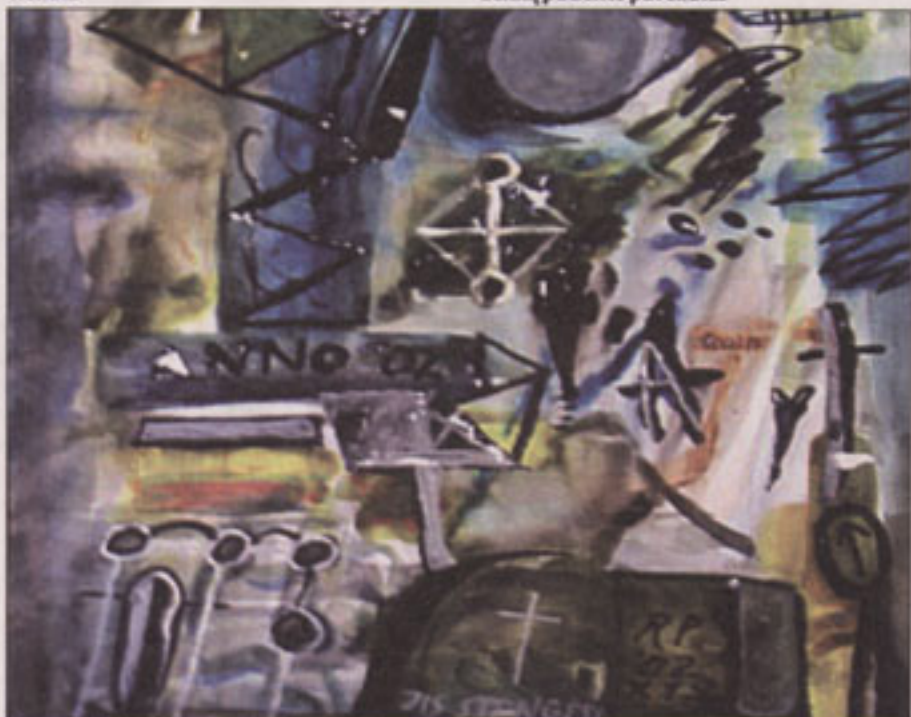
„Jis stengėsi“, 2002 m. Remigijaus P. piešinys