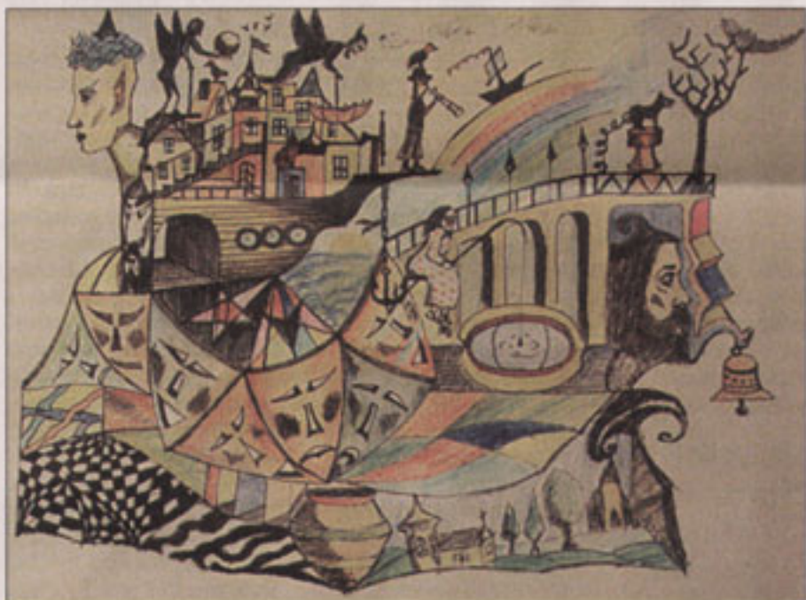
Vytauto piešinys (D. Survilaitės kolekcija)