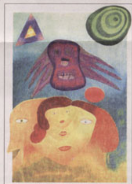
Lenkų paciento paveikslas