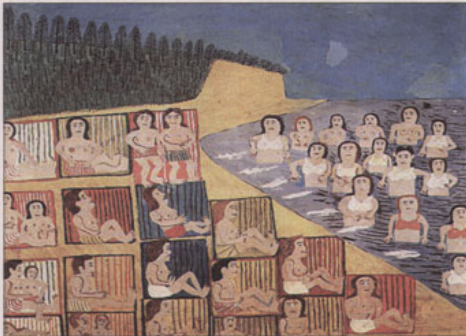
„Moterų pliažas“ (lenkų pacientas)