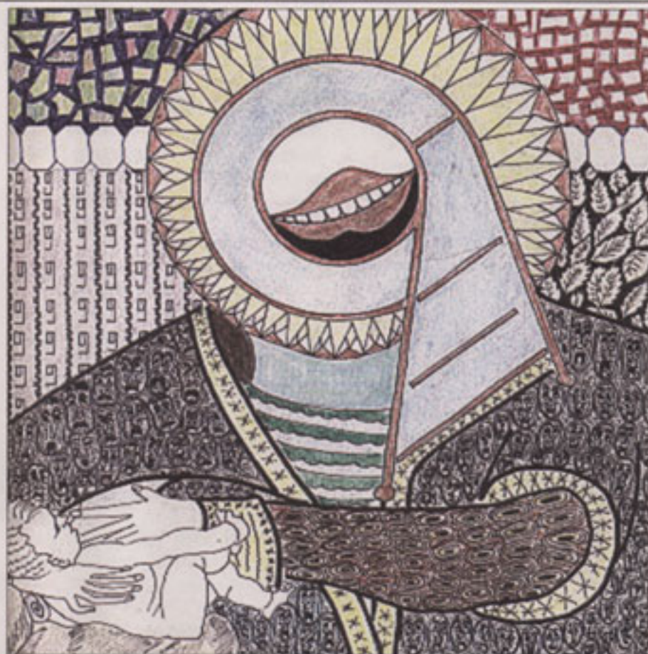
„Madona su kūdikiu“ (lenkų paciento paveikslas)